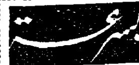
تأقضى - إسحاق - إبراهيم سكجها

قال إرثر غولديبرغ، مندوب الولايات المتحدة في الأمم المتحدة: إن للامريكانيين الحرية في تبادل آراءهم بحرية.